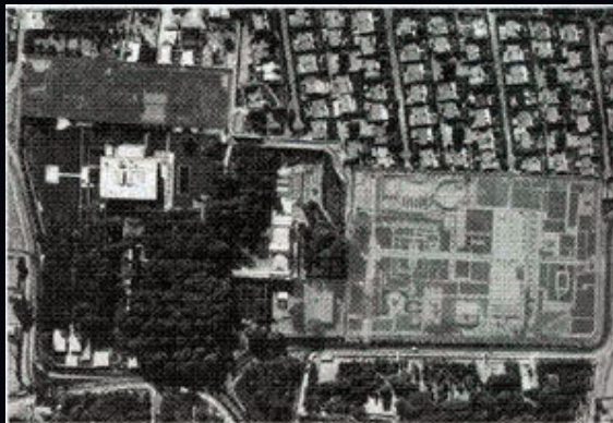
عکس هوایی سال ۱۳۴۸

باغ و ساختمان قدیمی سرای آرا، باغ جدید نیاوران، سینما و زمین های شاس در دهانه شرقی آن احداث گردیده اند بر حاش جنوبی آن در مجموع سه ساختمان کل، مکتب خان باکامه از حاش جنوبی آن ساخته شده. پارک نیاوران نیز در حاش جنوب آن قرار گرفته و توری از حیاط عالی پارک به حاش جنوبی سرور، در حاش جنوبی باغ احداث و در دهانه غربی آن قرار گرفته.